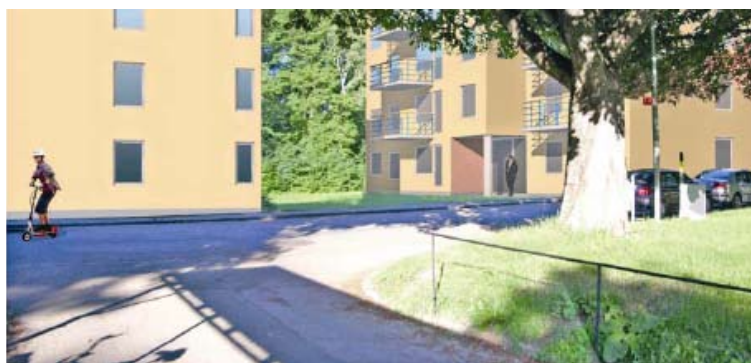
Fotomontage med föreslagna hus sedda från t-banestationens nedgång. Illustration: AG Arkitekter

De flesta remissinstanserna är positiva till bebyggelse, men har mindre invändningar i sakfrågorna. Förslaget har mött protester i området med hänvisning till kulturvärden och tillgången till grönytor.