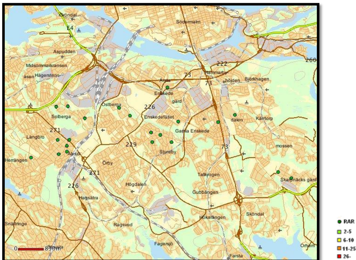
Karta över inbrott inom Lpo Globens område. Juni månad 2017.